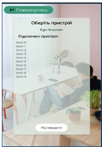
Рисунок 3 – Дизайн керування параметрами підключеного пристрою через Bluetooth

- Bluetooth Check Screen Activity: за допомогою Picker Screen Activity користувач може повернутися до екрана перевірки стану Bluetooth.