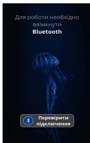
Рисунок 2 – Дизайн підключення пристрою по Bluetooth

Зображення підключення пристрою по представлено на рис.2.