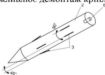
Рисунок 3 – Пальовий гарпун

Якщо анкер забивається під кутом близько 90^\circ до площини зсуву, він працює за своєю основною функцією. Проте забивка під кутом менше 75^\circ фактично змінює принцип його роботи, наближаючи його до шпунтового огороження (консольної системи), що потребує значно більшої щільності розміщення анкерів. Це, своєю чергою, призводить до зростання витрат та трудомісткості робіт. Забивка палі під кутом понад 100^\circ майже унеможливує демонтаж кріплення (1).