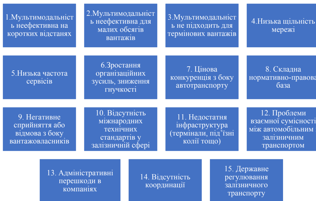
Рисунок 2 – Основні поточні блоки перешкод розвитку мультимодальності в ринку логістики

Кожне інтерв'ю за цими питаннями записувалося та згодом транскрибувалося інтерв'юером. Тривалість розмов становила приблизно 20–35 хвилин, загалом було зібрано понад 5 годин аудіоматеріалів. Після всіх інтерв'ю було сформовано практичну базу даних кожного з досліджуваних питань. Перелік ідентифікованих блоків перешкод розвитку мультимодальних ланцюгів доставки вантажів наведено на рисунку 2.